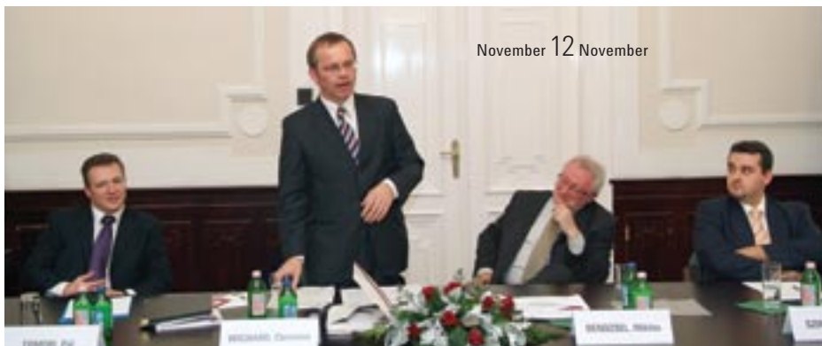
November 12 November

“Knowledge society and intellectual property protection – about intellectual property protection for journalists” – HPO–EPO seminary in Tihany.