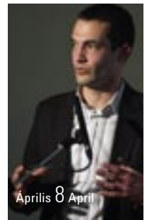
Április 8 April