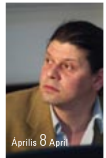
Április 8 April