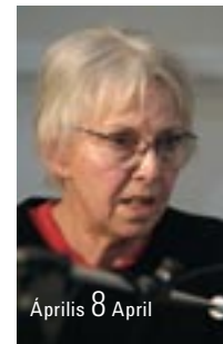
Április 8 April