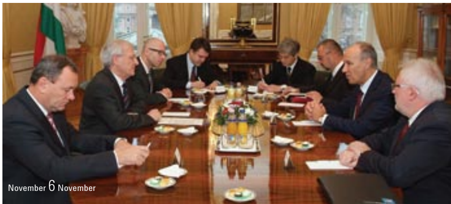
November 6 November

“You can also become an Inventor – or What is Intellectual Property Protection Good for?” – lecture organised in the framework of the Week of Young Entrepreneurs.