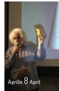
Április 8 April